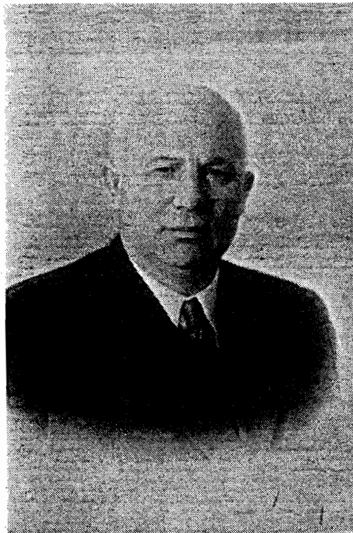
Н. С. Хрущев.

Совместное заседание Пленума Центрального Комитета КПСС, Совета Министров СССР и Президиума Верховного Совета СССР единогласно утверждает внесен-