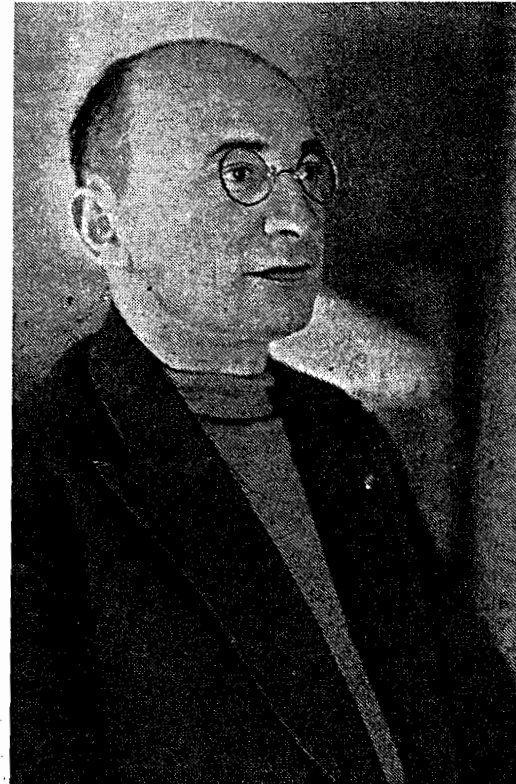
Л. П. Берия.

Комитета партии, Совета Министров Союза ССР, Президиума Верховного Совета СССР.