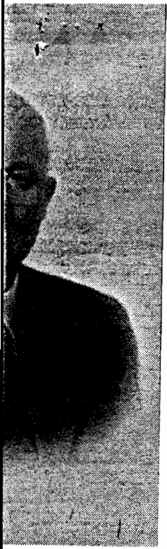
Н. С. Хрущев.

ные Бюро Президиума ЦК предложения о мероприятиях по организации партийного и государственного руководства (см. приложение) 4 .